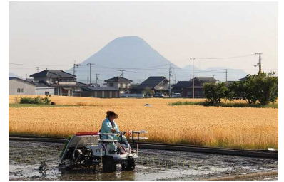
田植えが始まり田んぼでは カエルの合唱が響く