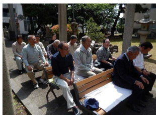
開始前、草薙会員からお話がありました。(写真左) 奉賛会と共に招魂祭を支援する丸亀支部会員(写真右)