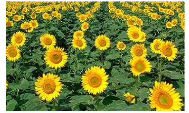
飯山高校のひまわりの花