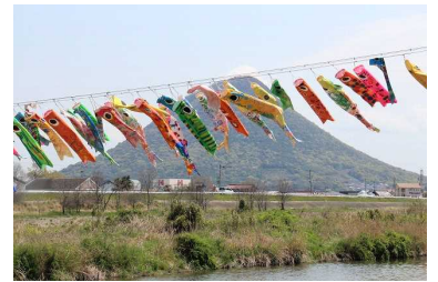
土器川にかかる 園児の 鯉のぼり